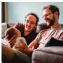
ALEEN KLEINE FOTOGRAFIE

Er komen twee officiële Lego-winkels in Nederland: Utrecht en Amsterdam! Nu alvast oefenen met de Duplo-app.