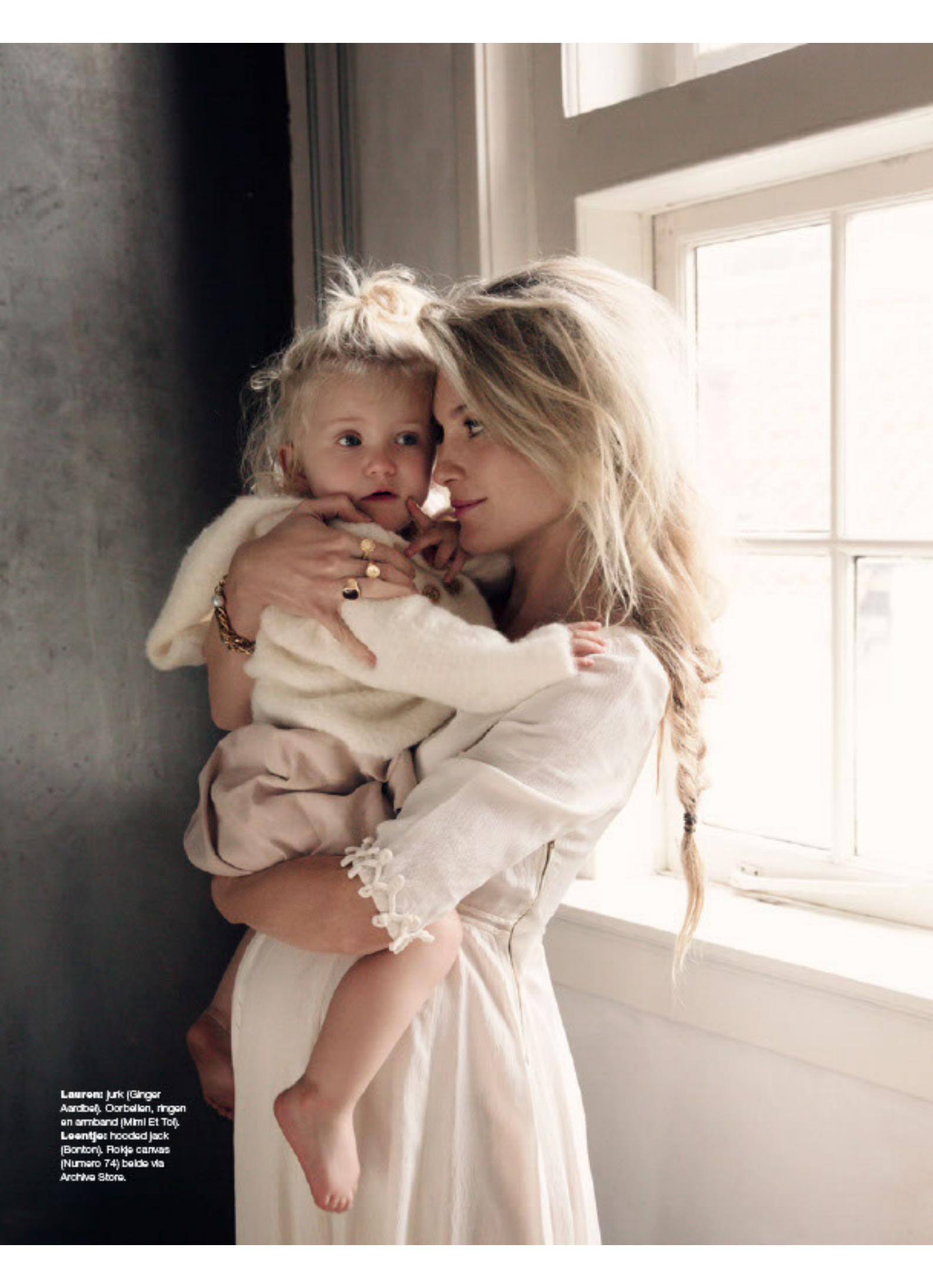
Lauren: Jurk (Ginger Aardbeï), Oorbellen, ringen en armband (Mimi Et Toï), Leentje: hooded Jack (Bonten), Rokje canvas (Numero 74) beide via Archiva Store.