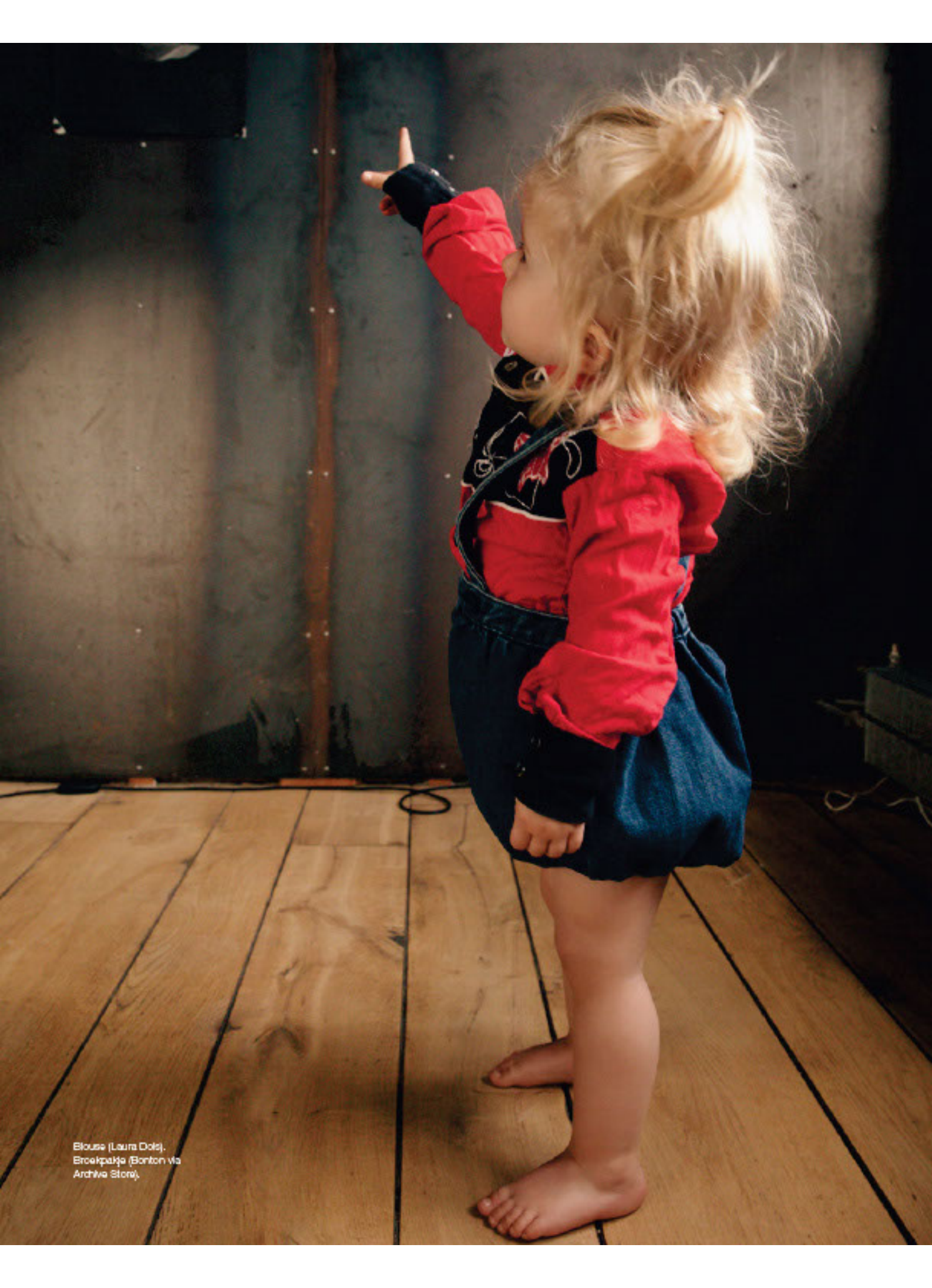
Blouse (Laura Dots), Broekpakje (Bonten via Archiva Store).